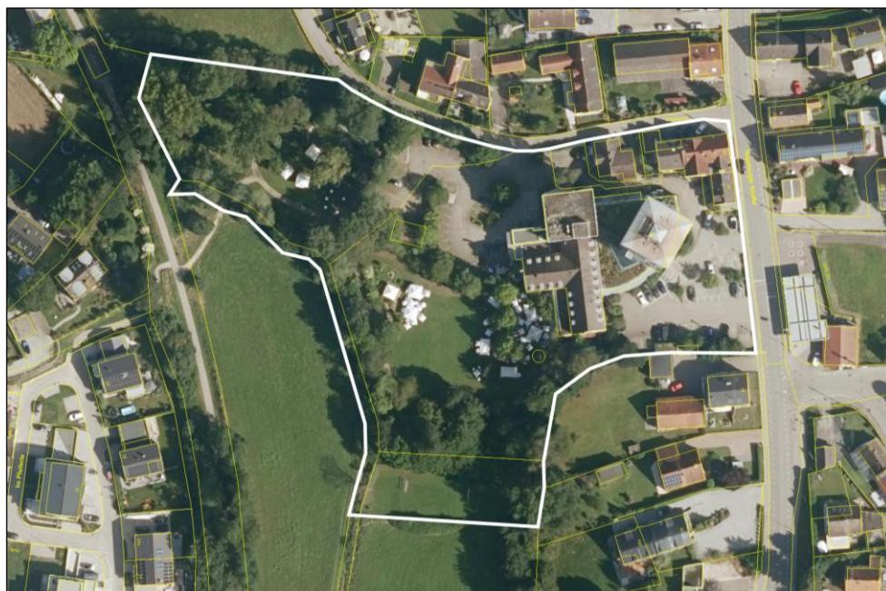
Abb. 2: Luftbild vorhandener Gehölzbestand

Das überplante Areal liegt innerhalb eines topografisch teilweise bewegten Umfeldes. Das Höhenniveau des Änderungsgebiets im Bereich unmittelbar entlang der Augsburgs Straße steigt von Norden nach Süden hin leicht an. Dabei beträgt der Höhenunterschied zwischen der südlichen (ca. 490,5 m ü. NHN) und der nördlichen Grenze (ca. 490,0 m ü. NN) etwa 0,5 m. Westlich des Hotelgebäudes fällt das Gelände von Osten nach Westen / Nordwesten zur Laugna hin ab. Hier beträgt der Höhenunterschied zwischen der nordwestlichen (ca. 486,5 m ü. NHN) und der östlichen Grenze (ca. 488,0 m ü. NN, Bereich Biergarten) etwa 1,5 m. Der Höhensprung zwischen dem östlich liegenden Parkplatz und dem westlich liegenden Biergarten wird südlich des Hotelgebäudes durch einen kleinen Böschungsbereich überbrückt.