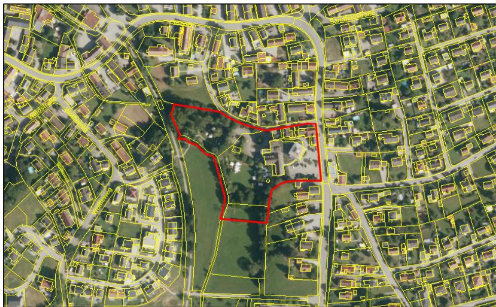
Abb. 1: Übersichtslageplan Umgriff Änderungsgebiet

Das Änderungsgebiet befindet sich im südlichen Teil der Ortslage Adelsried, westlich der Augsburger Straße, südlich der Kirchgasse und östlich des Gewäs- sers der Laugna. Das Ortszentrum Adelsried mit dem Rathaus liegt in einer Ent- fernung von etwa 200 m nordwestlich des Änderungsgebietes und ist über den Welden Radweg fußläufig erreichbar.