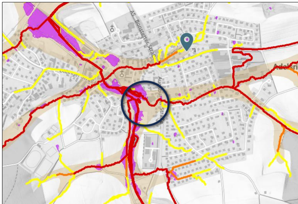
Abb. 3: Auszug Hinweiskarte Oberflächenwasser und Sturzflut

Die Flächen entlang der Laugna sowie der nordwestliche Randbereich des Änderungsgebiets sind als Bestandteil von Hochwassergefahrenflächen HQ 100 gekennzeichnet. Infolge der Lage und Topografie des Änderungsgebiets besteht insbesondere bei Starkregenereignissen grundsätzlich eine Gefahr von wild abfließendem Wasser. In der Hinweiskarte Oberflächenabfluss und Sturzflut des Bayerischen Landesamtes für Umwelt ist südlich des Hotels ein potenzieller Fließweg mit starkem Abfluss dargestellt, der über die westliche Park- / Grünanlage nach Nordwesten verläuft. Zudem ist das Gewässer der Laugna als potenzieller Fließweg mit starkem Abfluss gekennzeichnet. Wie das weiterführende Siedlungsgebiet im Umfeld der Laugna ist auch der nordwestliche Teil des Änderungsgebietes als „wassersensibler Bereich“ gekennzeichnet.