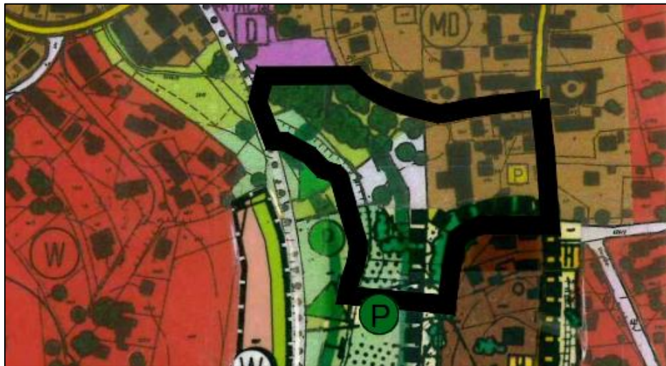
Abb. 4: Auszug aus dem rechtswirksamen FNP der Gemeinde Adelsried

Die planungsrechtliche Sicherung des bereits bestehenden Tagungs- und Veranstaltungshotels sowie dessen Außenbereiche in der Ortslage Adelsried kann somit momentan nicht vollständig aus den Darstellungen des Flächennutzungsplanes abgeleitet werden. Zur Realisierung dieser planungsrechtliche Sicherung soll der Änderungsbereich des Flächennutzungsplanes entsprechend der geplanten Nutzung künftig als „gemischte Baufläche“ (M) dargestellt werden. Die Flächen entlang der Laugna sowie im südlichen und nordwestlichen Änderungsbereich werden als „Grünfläche“ ausgewiesen, die entlang der Laugna weiterhin als „Fläche mit besonderer ökologischer orts- und landschaftsgestalterischer Bedeutung“ gekennzeichnet sind. Zudem werden die bestehenden Gehölze auch weiterhin als „Busch- und Baumgruppe, Einzelbaum“ dargestellt. Die Kennzeichnung der bestehenden Pkw-Stellplätze westlich der Augsburgers Straße als „Parkplatz, privat“ wird ebenfalls beibehalten.